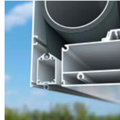
Bei der Camargue ist die Endschiene in der Kassette verborgen.

Der integrierte Fixscreen ist mit unserer patentierten Connect&Go®-Technologie ausgestattet. Dieses neue Konzept bietet einen großen Vorteil im Hinblick auf Einbau und Ausbau der Tuchrolle beim Austauschen von Tuch oder Motor.